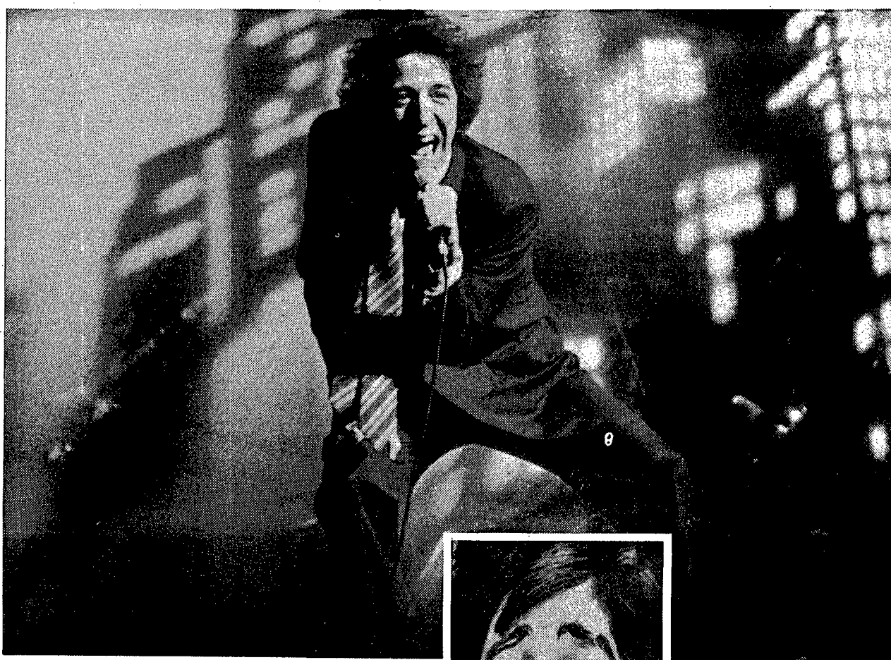
Gaber attore e cantante e, sotto, visto dalla matita di Walter Molino